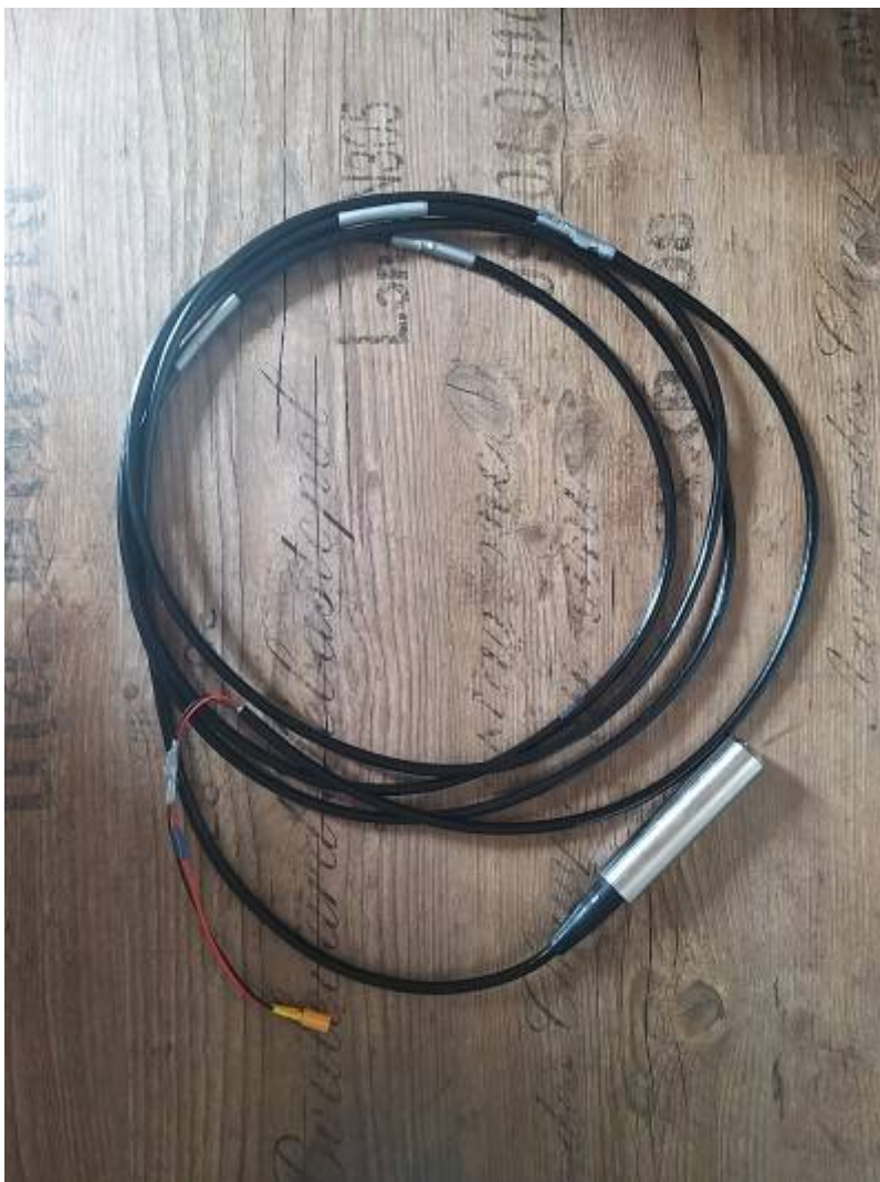
Fig. 4: Prototyp 1-Sonde

Der Aufbau ist bewusst einfach und modular gestaltet um im Notfall Komponenten schnell auswechseln zu können.