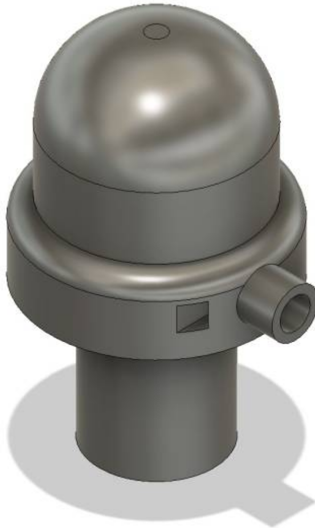
Fig. 7: Kappe