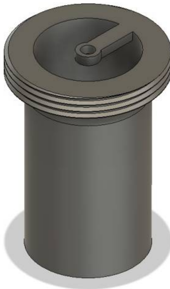
Fig. 6: Inlay

Weiterhin wurde auch ein Gehäuse für die Technik designed.