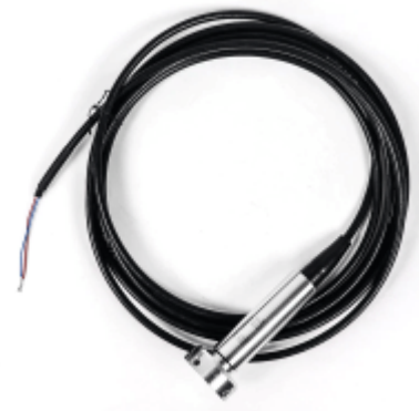
Fig. 2: Pegeldrucksonde