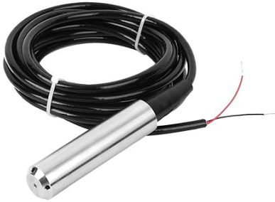
Fig. 2: Pegeldurcksonde

Diese Art von Sensoren wird meist über die Stromschnittstelle "4 .. 20mA" betrieben. Dabei muss die Node den Strom messen, welcher der Sensor verbraucht. Dieser liegt dann zwischen 4mA und 20mA. Der Messbereich des Sensors muss dann auf den Bereich 4mA bis 20mA übertragen werden. Ist der Messbereich des Sensors bspw. mit 0m bis 100m angegeben, würde bei einer 0m Messung 4mA an Strom fließen und bei 100m 20mA.