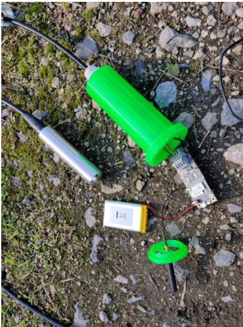
Fig. 8: Rak 4630 Board mit Batterie

Zur Befestigung der Antenne wurde ein Halter 3D-gedruckt.