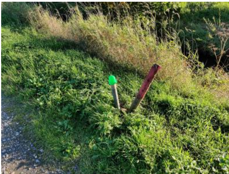
Fig. 8: Installation mit Deckel