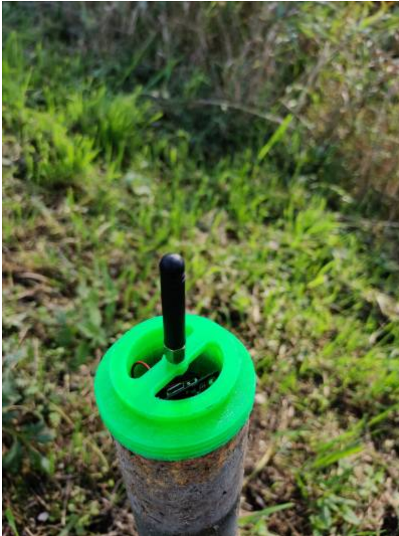
Fig. 8: Sensor und LoRa-Sender im Rohr installiert