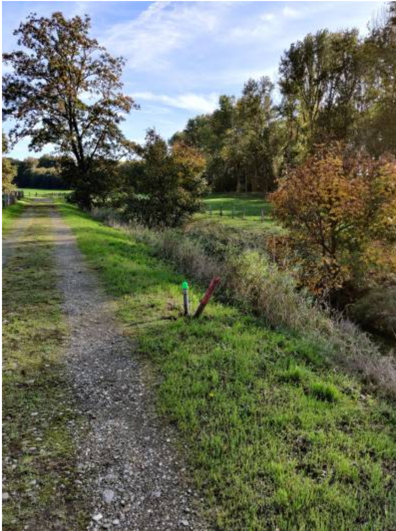
Fig. 8: Installation mit Kappe