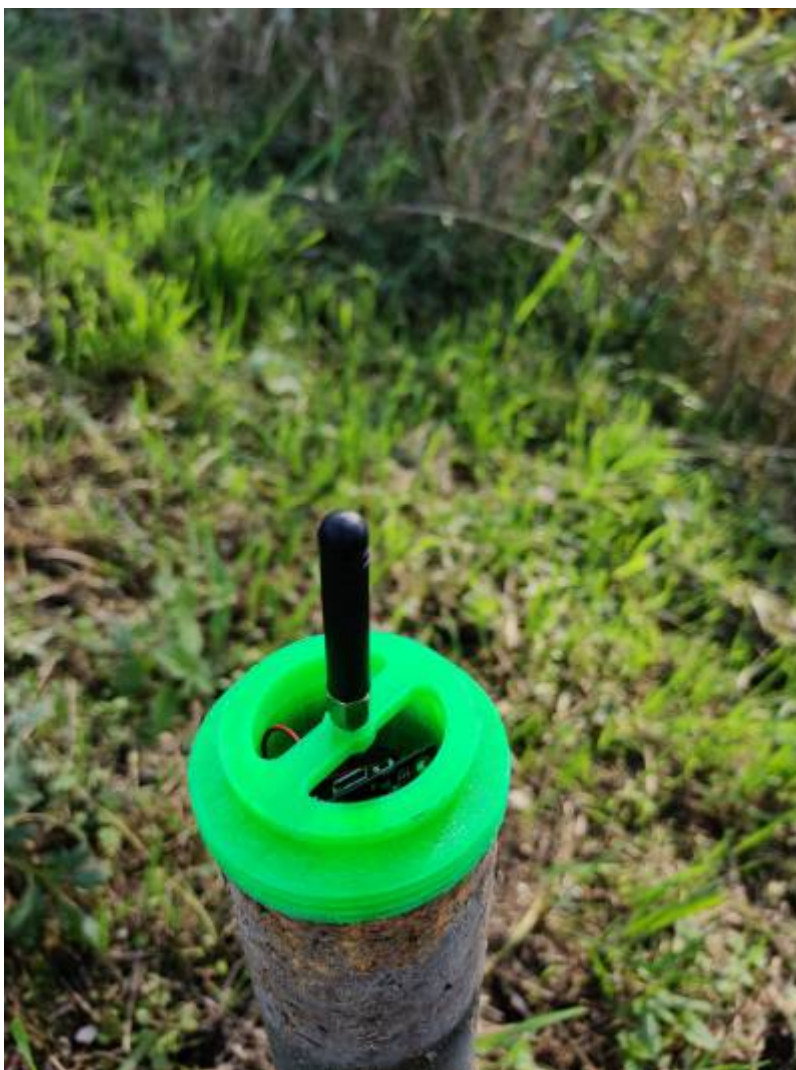
Fig. 8: Sensor und LoRa-Sender im Rohr installiert

Zur Befestigung der Antenne wurde ein Halter 3D-gedruckt.