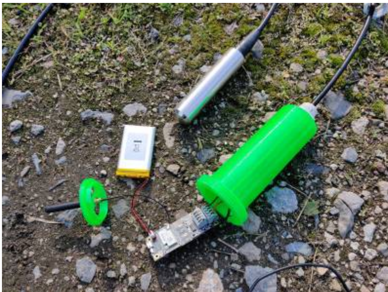
Fig. 8: Rak 4630 Board mit Batterie

Zur Befestigung der Antenne wurde ein Halter 3D-gedruckt.