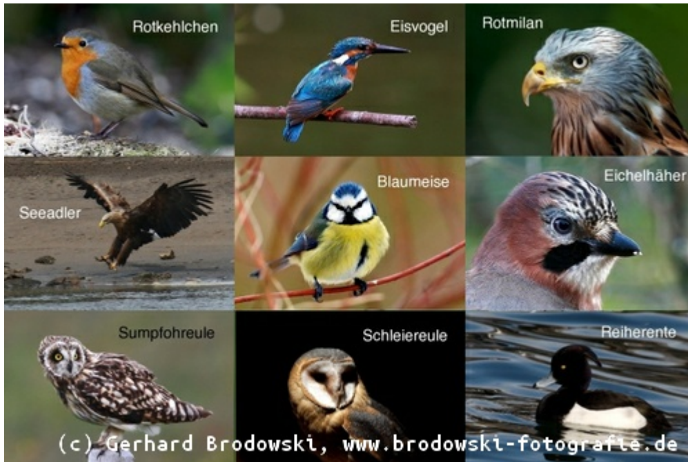
Hier sind ein paar Heimische Vogelarten abgebildet.

From: https://student-wiki.eolab.de/ - HSRW EOLab Students Wiki