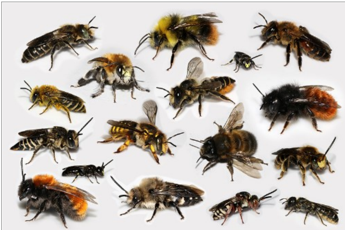
Verschiedene Wildbienenarten.